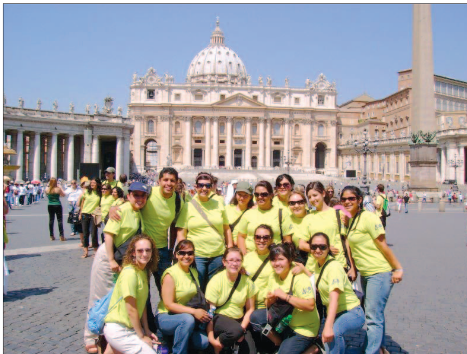
Participantes en el Encuentro Internacional de Jóvenes-Adultos de la Diócesis de Orange, ante el Vaticano.

El grupo de jóvenes de Estados Unidos tuvimos la oportunidad de quedarnos unos días extras en Roma, en la Casa General de las Religiosas de la Compañía de María. Aquí tuvimos la oportunidad de contemplar de cerca el centro de la universalidad de la Iglesia: