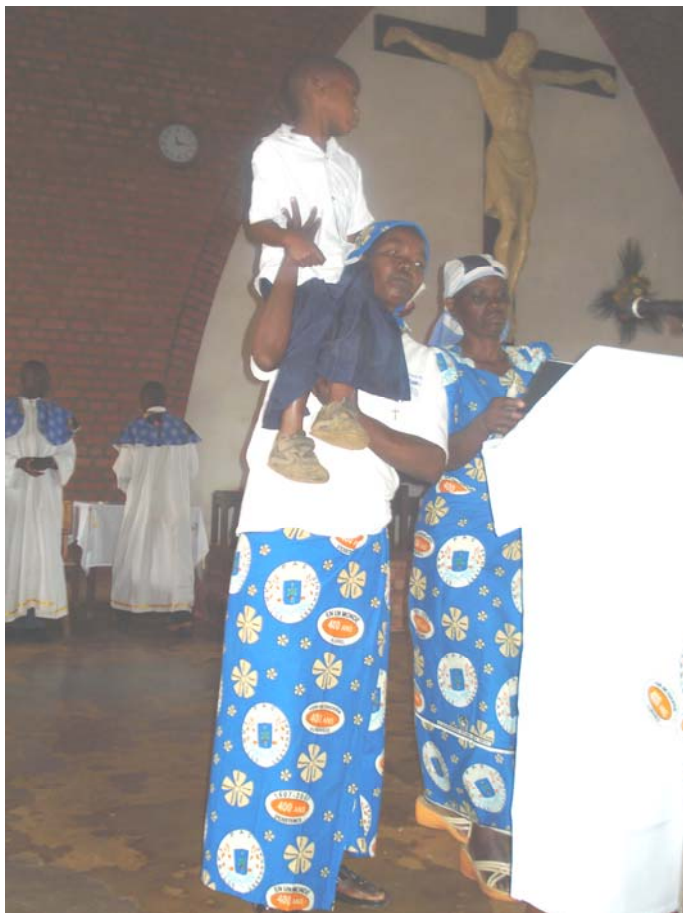
5.4. Pendant l'offertoire, plusieurs symboles dont :