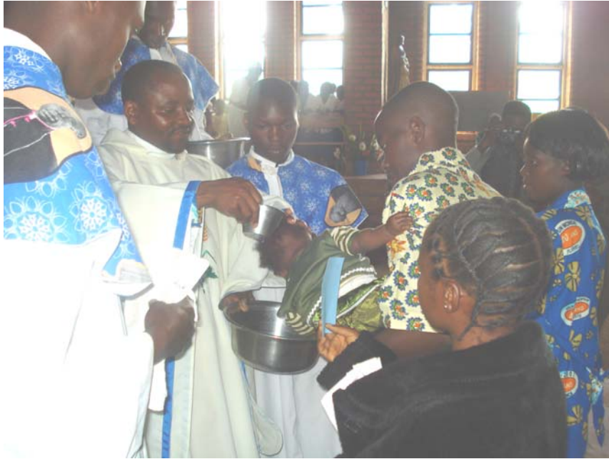
5.3 Après l'homélie du Père Célébrant : baptême d'un enfant d'un couple "récupéré".